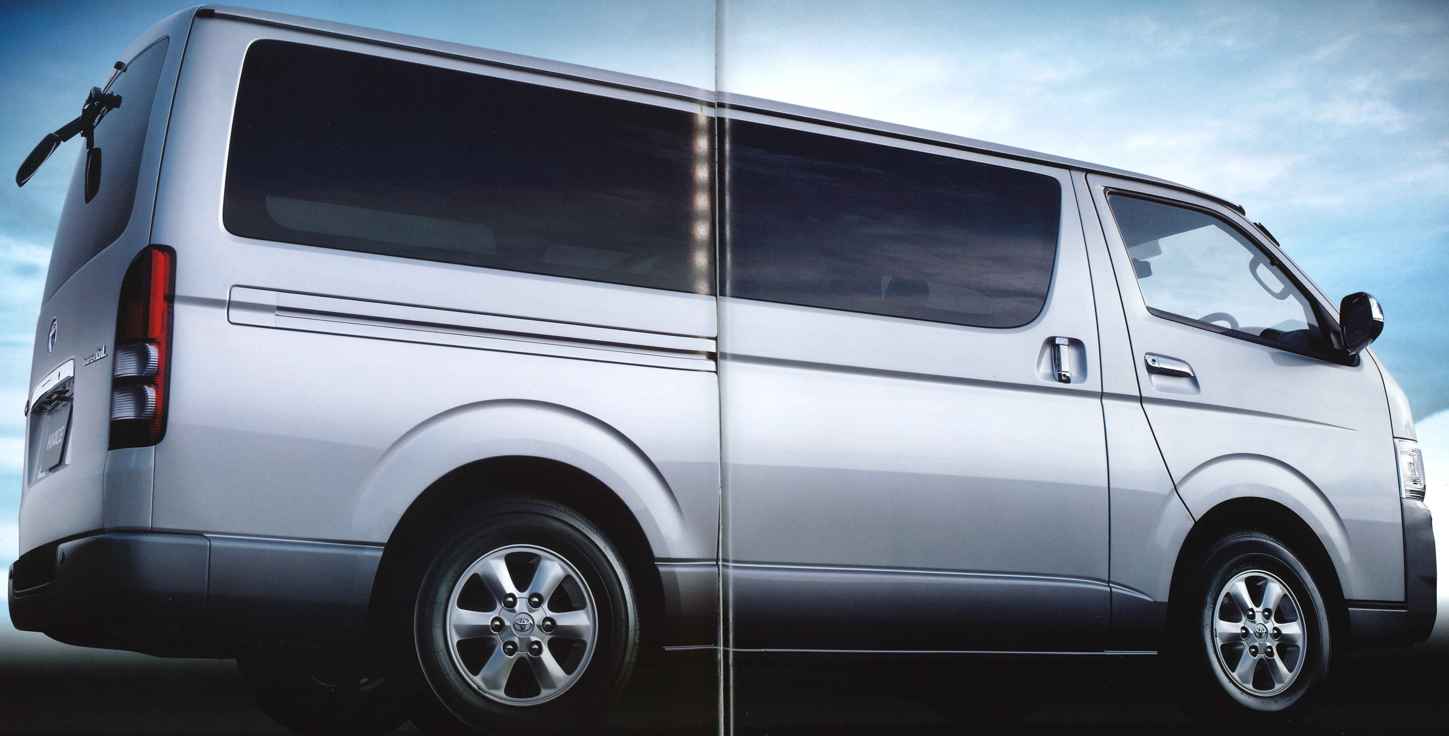
Photo: 2WD・3000ディーゼル・ロングバン・2/5人乗り・5ドア・スーパーGL。ボディカラーのインテリジェントシルバーターニング<2JN>はメーカーオプション。アルミホイール、クリアランスソナー&バックソナー(4センサー)、固定式リヤサイドガラス(プライバシー)、HDDナビゲーションシステム&4スピーカー&音声ガイダンス機能付カラーバックガイドモニターはメーカーオプション。